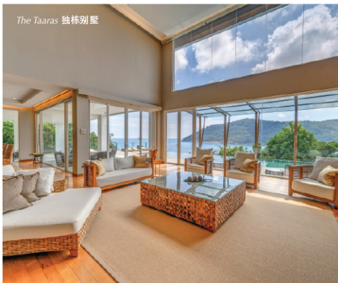
The Taaras 独栋别墅

塔拉斯海滩和水疗度假村共设有125间雅致客房与套房，更有一座坐落悬崖之上的五卧奢华别墅——俯瞰无边海景与全城度假村，专为追求私密与尊贵体验的旅人而设。每间客房配备特大床或双床，搭配精挑细选的寝具与面料，为您营造极致舒适的居住享受。